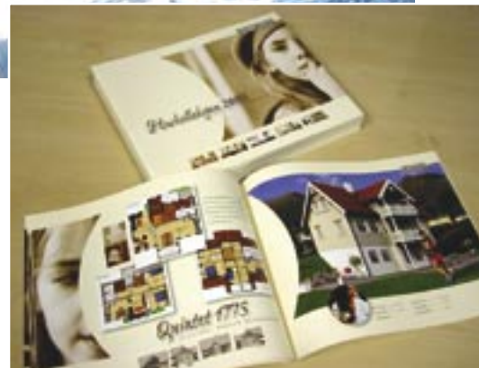
De nieuwe huizenkatalogus van Byggmann

heeft een Nederlandse eigenaar, dus de taal is geen probleem en ze serveren je bovendien een heerlijke 'landgang' of 'hamburger'. Verder zijn er in Stordal appartementen (leiligheter) te huur, zijn er twee geheel nieuwe appartementjes aan de rand van de boothaven te huur en kun je logeren in de unieke Blåtind Appartemenen, iets verderop in de bergen.