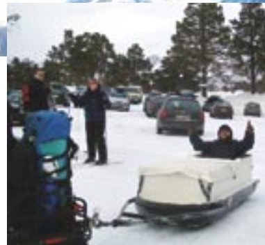
Foto: Links sta ik wel stoer te doen, maar rechts bevalt me beter!

SKORGEDALEN – Het plan ligt al een tijdje klaar om met een aantal gelijk gestemde Nederlandse zielen twee dagen naar een hut in de bergen te gaan. Een goede gelegenheid om elkaar beter te leren kennen en van gedachten te wisselen over onze gezamenlijke expertises.