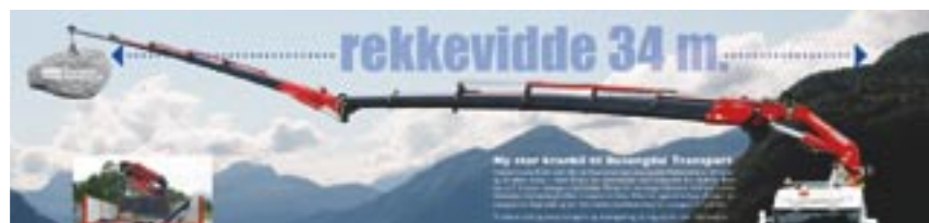
Mailing voor Busengdal Transport uit Stordal ter introductie van de grootste kraanwagen in de provincie