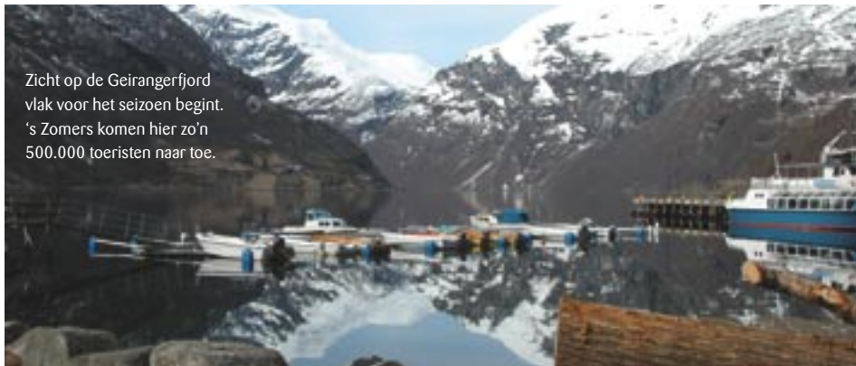
Zicht op de Geirangerfjord vlak voor het seizoen begint. 's Zomers komen hier zo'n 500.000 toeristen naar toe.