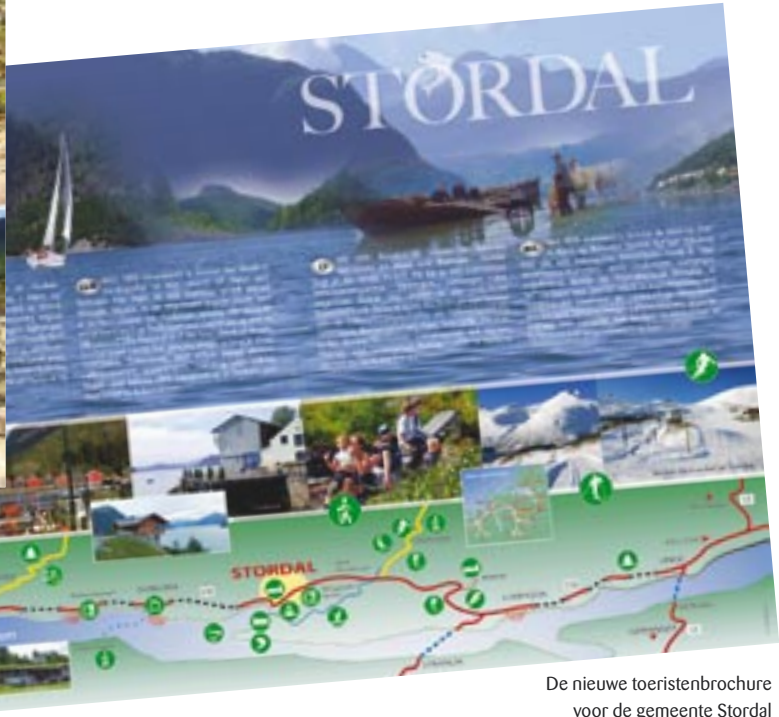
De nieuwe toeristenbrochure voor de gemeente Stordal