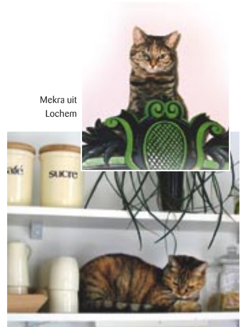
Mouse uit Apeldoorn

Ja, en dan moet ik het nog even hebben over de fanmail, die ik regelmatig krijg. Hartstikke leuk natuurlijk om foto's en brieven te krijgen. Twee bijzondere fans zijn de poezen Mekra en Mouse. Zij stuurden me bijgaande foto's. Ze hebben allebei blijkbaar een voorliefde voor niet alledaagse plekken om te gaan uitrusten, maar ja daar moet je ook een poes voor zijn nietwaar. Ik zie me zelf al in de keukenkast liggen. Het vrouwtje ziet me aankomen.