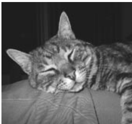
Foto: La Reina van St. Odilienberg met als roepnaam Pasja

WEOF – Het heeft even geduurd, dat ik weer wat naar jullie kan schrijven, maar hier ben ik dan weer. Mijn baasje en vrouwtje schijnen het nogal druk gehad te hebben de laatste tijd. Voordat ik het wist woonden we alweer in een ander huis. Ik word eigenlijk een beetje gek van al dat verhuizen. Was ik net gewend waar alles stond, kan ik opnieuw overal met mijn kop tegenaan lopen. Ze vergeten volgens mij gewoon dat ik een oude, blinde hond ben. Het is hier trouwens wel fijn hoor. Lekker ruim met een grote veranda, zodat ik lekker de hele dag buiten kan liggen als het mooi weer is.