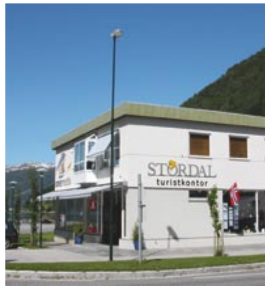
De buitengevel met uitzicht op de fjord