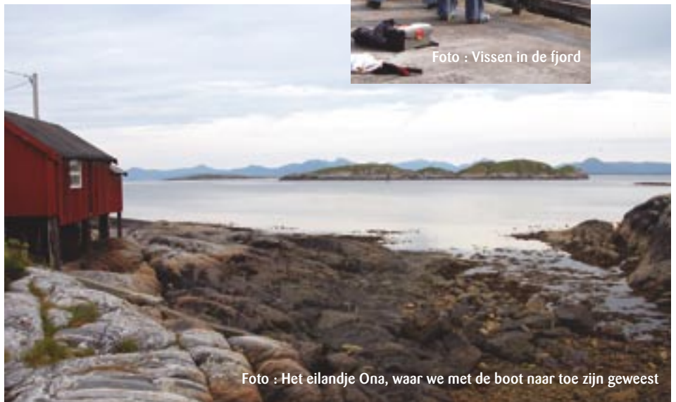
Foto : Het eilandje Ona, waar we met de boot naar toe zijn geweest