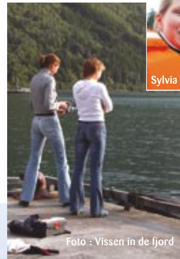
Foto : Vissen in de fjord