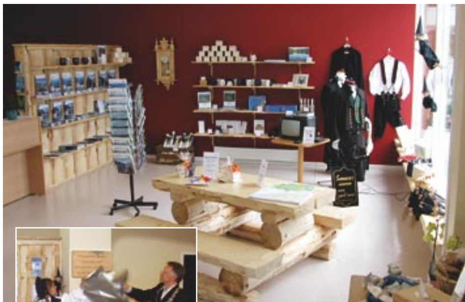
Foto: Het interieur van de winkel