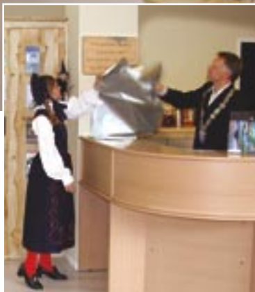
Foto: De openingshandeling